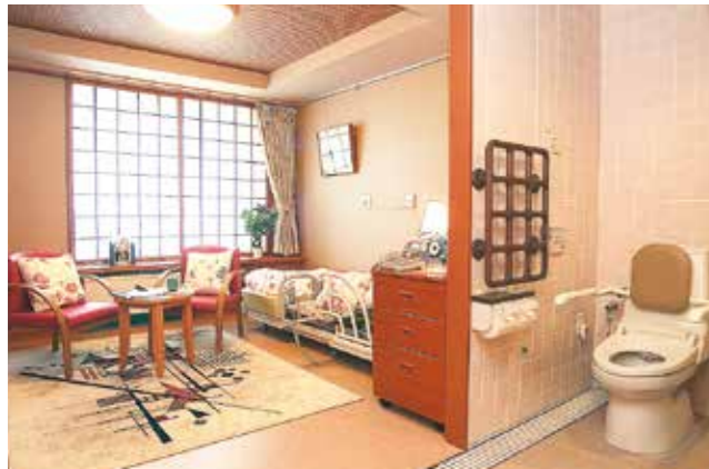
Aタイプ室内写真 ※家具等はサンプルです。