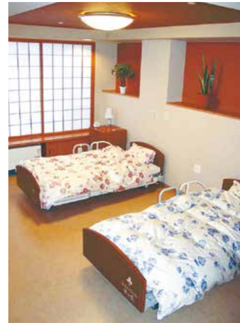
Bタイプ室内写真 ※装飾品等はサンプルです。